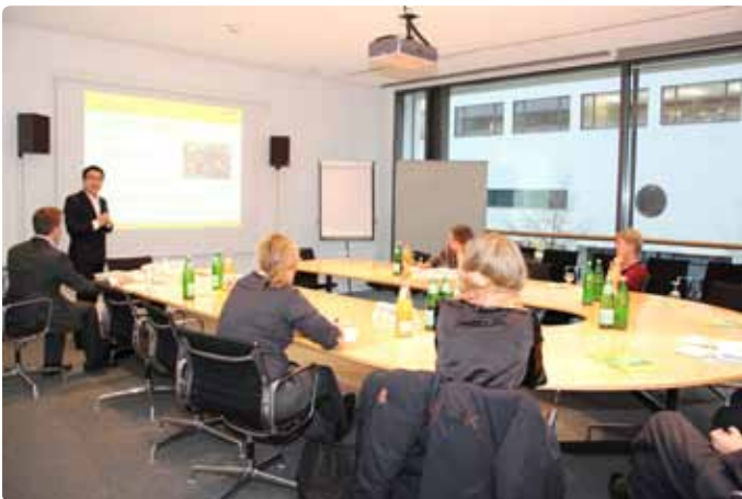
Workshop Deutsche Post DHL