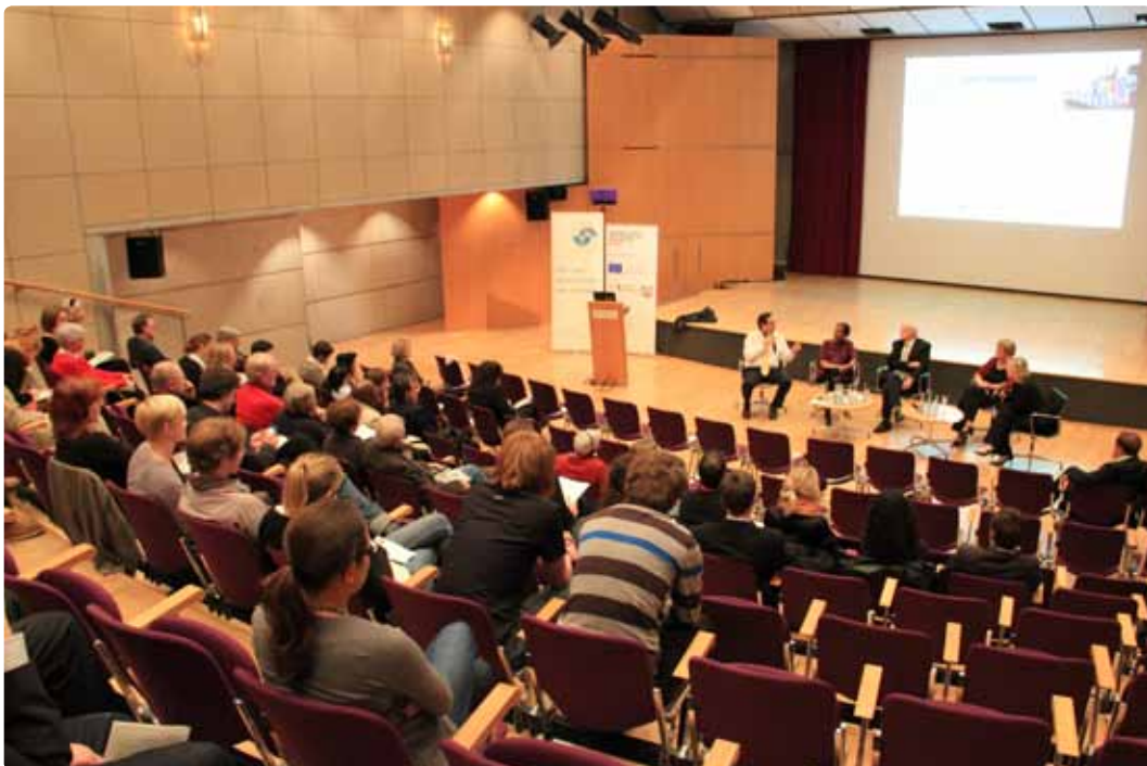
Abendveranstaltung im Haus der Geschichte